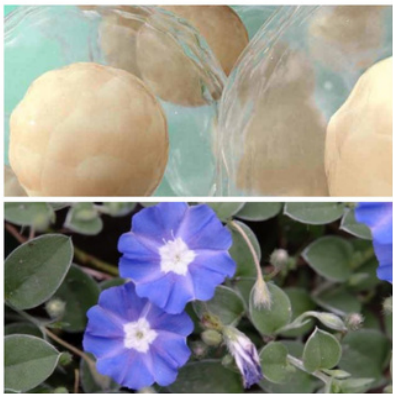
Benefits Evolvulus alsinoides

loss of memory sleeplessness chronic bronchitis asthma syphilis used in the treatment of epilepsy cuts ulcers.